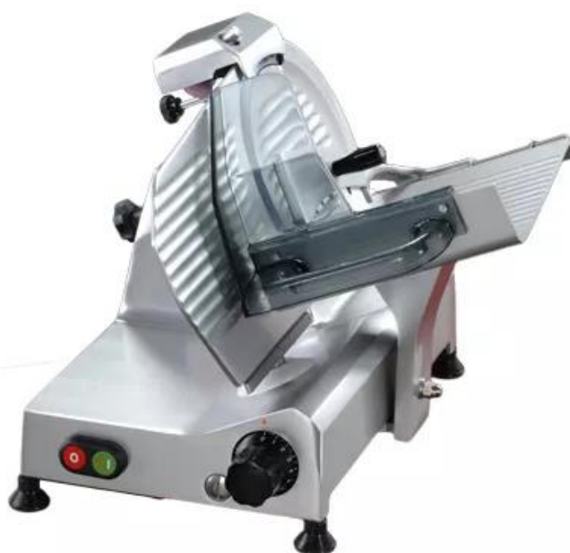
S 220 AF DOM