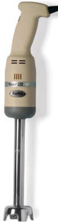
Mescolatore Blending Tube 250 mm