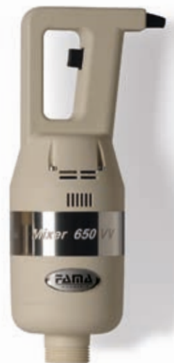
MIXER 650 VV