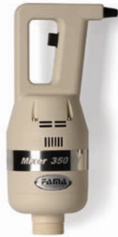
MIXER 350 VV

La tecnologia SRS consente di ottenere composti estremamente omogenei. SRS device grants high-quality homogeneous mixtures.