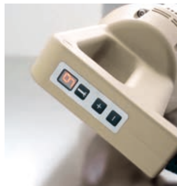
Regolatore a 9 velocità con display luminoso Luminous display with 9 speeds regulator

FSP Supporto pentola regolabile e con snodo libero Adjustable pot support with free articulated joint