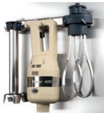
FSPC Support parete Wall support