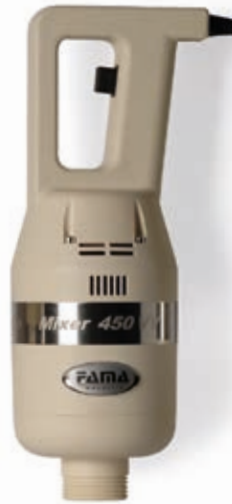
MIXER 450 VV