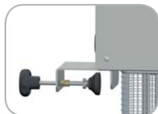
Morsetto per fissaggio pentola Pot fixing clamp